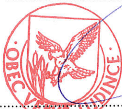
Bc. Zita Čseri štatutárny zástupca